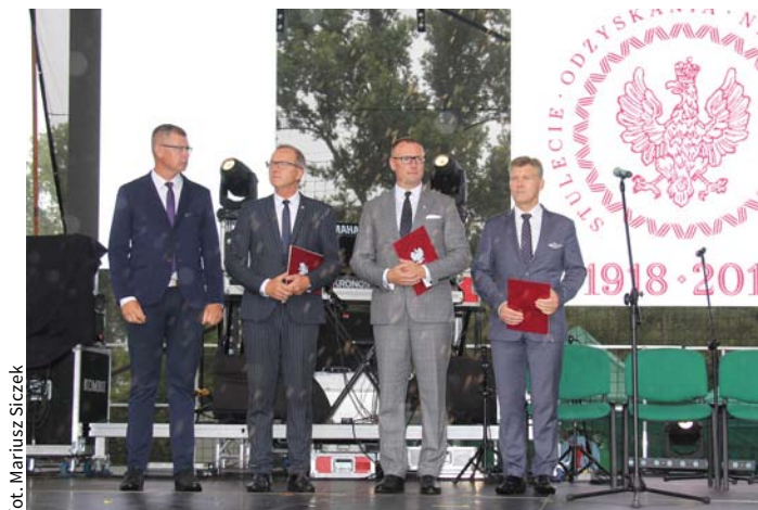
Wydarzenie objął Patronatem Narodowym w Stulecie Odzyskania Niepodległości Prezydent Rzeczypospolitej Polskiej Andrzej Duda.

Po burzliwych naradach, jury ogłosiło werdykt. Miejsca pierwsze otrzymał wieniec w kształcie korony, wykonany przez sołectwo Bierwce w gminie Jedlińsk. Został on wykonany przez panią sołtys, radę sołectkiej oraz członkinie zespołu Biesiada Bierwiecka. Ma tradycyjny kształt korony, a do jego wykonania użyto ziaren i nasion zbóż oraz kwiatów i gałęzi krzewów.