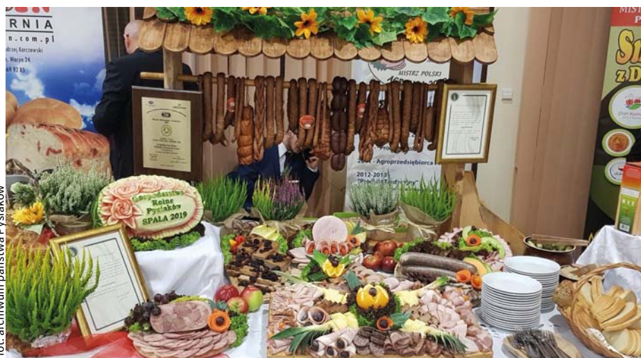
Specjały z Gospodarstwa Rolnego Państwa Pysiaków cieszą nie tylko podniebienie, ale i oko.

– Tego rodzaju konkursy jak Perła Powiatu to świetny pomysł. I warto, żeby kontynuować jego tradycje, doceniać tych, którzy dzięki ciężkiej pracy tworzą niesamowity krajobraz gospodarczy naszej małej ojczyzny. Wszystkim, którzy przystąpią do kolejnych edycji tego konkursu, życzę powodzenia – podsumował gospodarz. ●