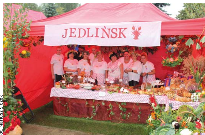
Piękne stoiska sołectkie z gminy Jedlińsk mogliśmy podziwiać podczas Święta Plonów.