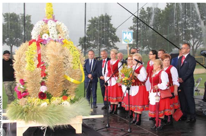
Obśpiewywanie wienca w wykonaniu Zespołu ludowego Owadowianki z gminy Jastrzębia.