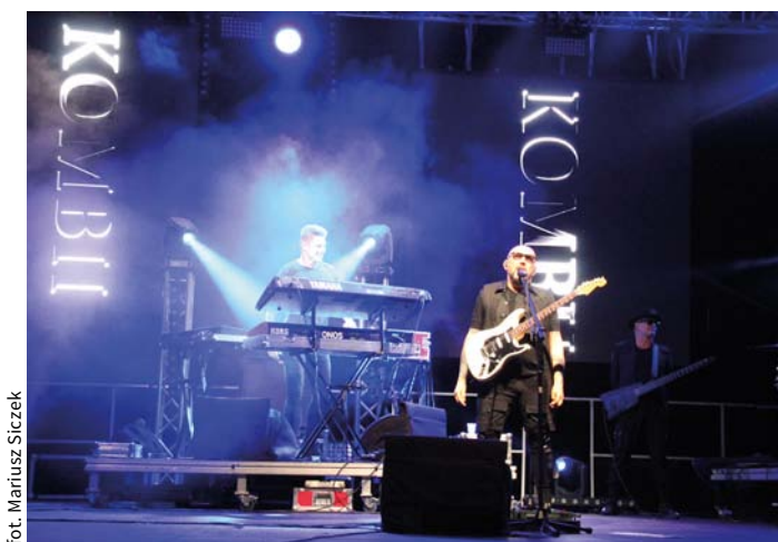
Gwiazda polskiej sceny muzycznej, legendarny Zespół Kombii.

Drugą nagrodę zdobył wieniec z gminy Jastrzębia wykonany przez Zespół Ludowy Owadowianki. Trzecią nagrodę otrzymał wieniec Koła Gospodyń Wiejskich z Płaskowa w gminie Jedlińsk. Pozostałych 17 wienców zdobyło ex aequo czwarte miejsce.