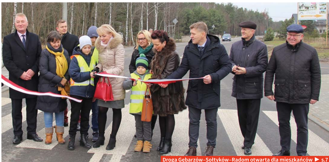
Droga Gębarzów–Sołtyków–Radom otwarta dla mieszkańców ▶ s.7