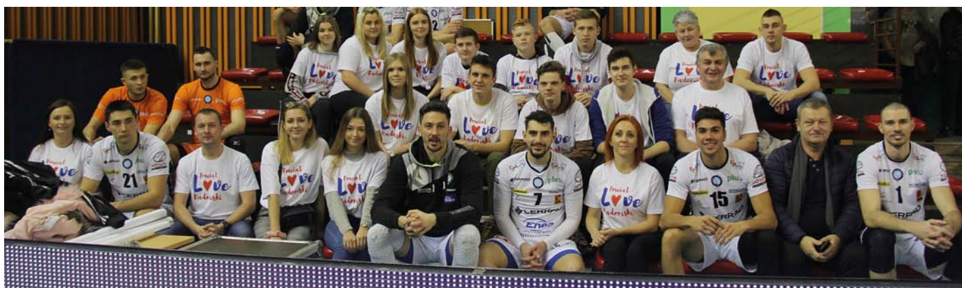
Siatkarzy Cerradu Enea Czarni dopingowała liczna grupa mieszkańców powiatu radomskiego w szczególności uczniów ze szkół powiatowych.

domki Radom. Po dziewięciu przegranych konfrontacjach, zmierzyły się z ekipą Volley Wrocław. Nie tylko wygrały, ale zgarnęły także komplet bezcennych w walce o utrzymanie punktów. ●