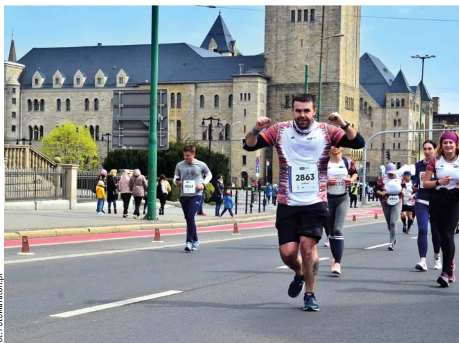
Finisz Półmaratonu Poznańskiego.

– Ważyłem 120 kg, a obecnie 98 kg. Jestem sprawniejszy, zdrowszy i mam lepsze wyniki badań. Poznałem wielu wspaniałych ludzi, dlatego też wszystkich zachęcam do aktywności fizycznej. Do biegania bardzo mobilizuje mnie rodzina oraz znajomi, na których zawsze mogę liczyć. Ważną rolę odgrywają też ludzie ze Street Run Radom i Bieganiem Radom!, którzy chętnie dzielą się doświadczeniami. Wspólnie trenujemy i startujemy w biegach w całej Polsce. ●