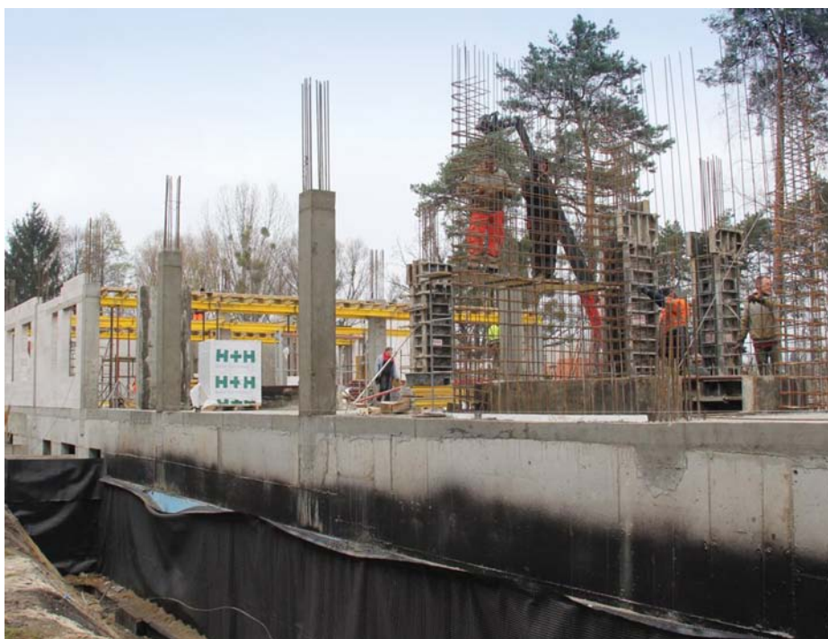
Niespełna dwa miesiące po rozpoczęciu inwestycji, widać już efekty prac budowlanych.