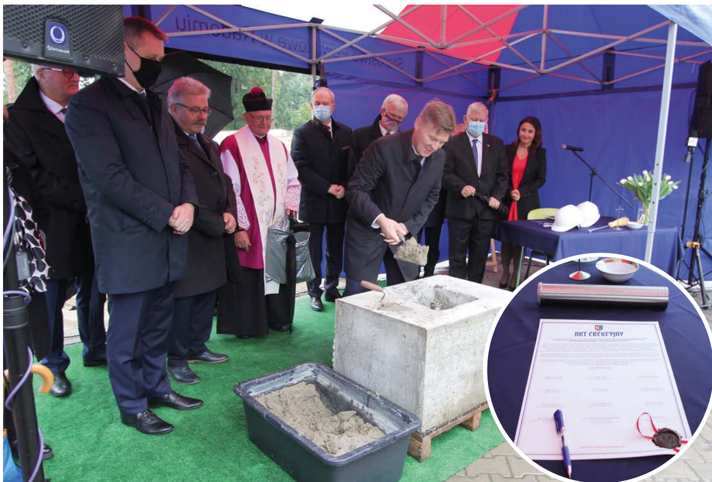
Symboliczne rozpoczęcie inwestycji 20-lecia powiatu radomskiego, czyli wmurowanie kamienia węgielnego pod budowę nowego pawilonu zabiegowego szpitala w Pionkach.