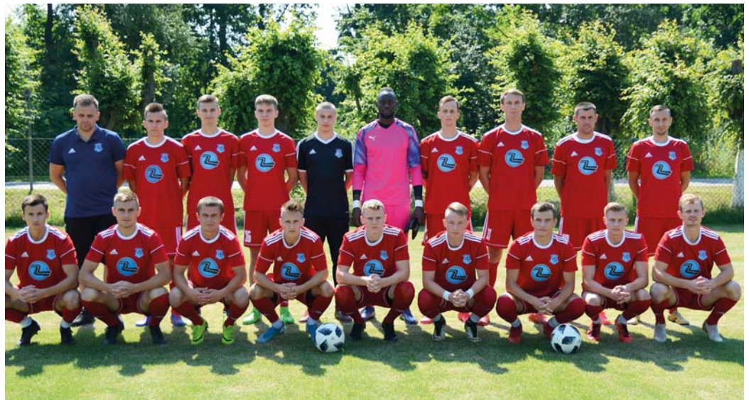
GKS Drogowiec jest najwyżej sklasyfikowaną ekipą z powiatu w Tymex Lidze Okręgowej.