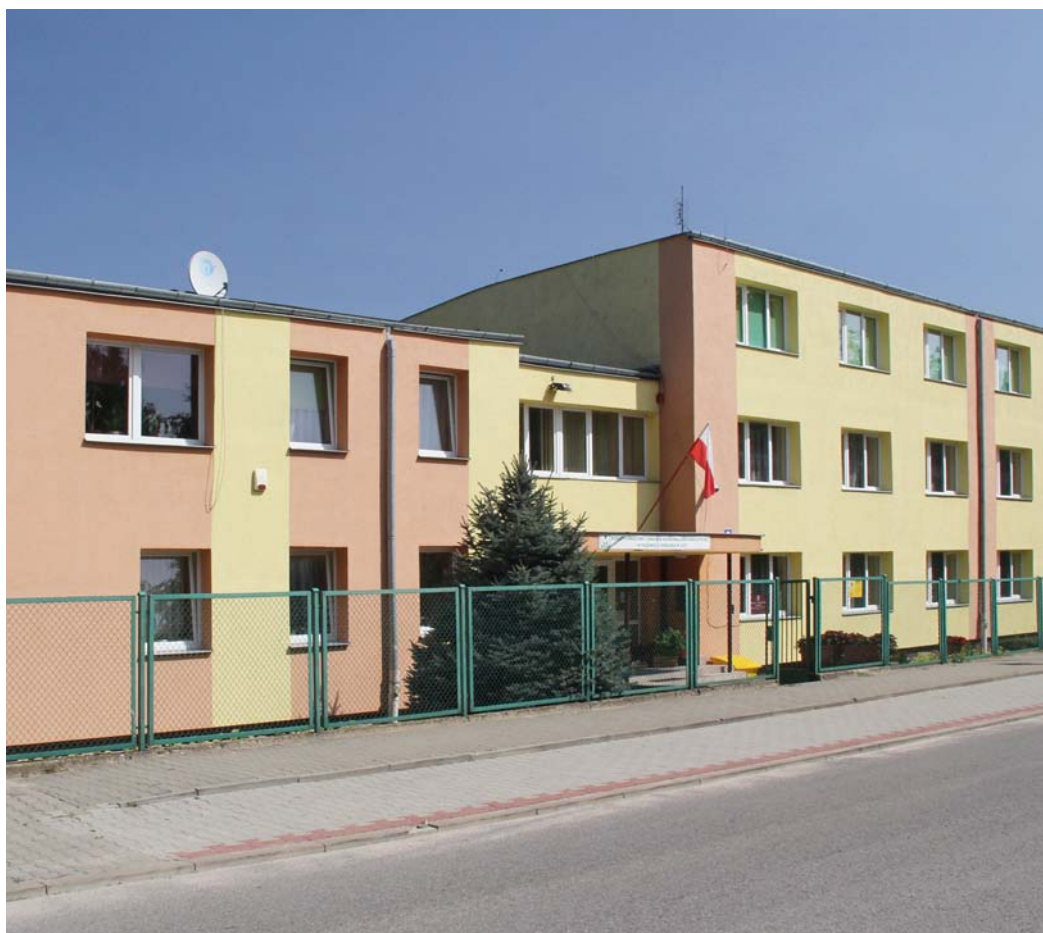
Siedzibą nowej jednostki samorządowej, czyli Powiatowego Instytutu Kultury będzie budynek przy ul. Jakubowskiego w Iłży.

Radni Powiatu Radomskiego powołali nową samorządową instytucję pod nazwą Powiatowy Instytut Kultury. Ma on przejąć zadania biblioteki powiatowej, rozwijać działalność kulturalną oraz wspierać organizacje pozarządowe.