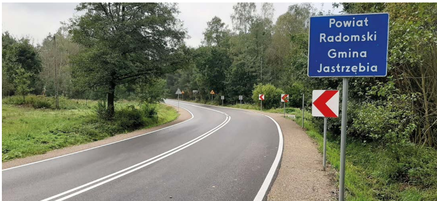
Na terenie Powiatu Radomskiego powstało w tym roku blisko 25 kilometrów nowych dróg. Na zdjęciu fragment drogi powiatowej Jedlińsk-Łukawa-Głowaczów w gminie Jastrzębia.

Blisko 25 km dróg powiatowych przebudowanych, a kolejne 10,5 km wyremontowanych – to najnowsze dane o inwestycjach drogowych w 2020 roku, które przygotował Powiatowy Zarząd Dróg Publicznych. Wartość inwestycji przekroczyła już kwotę 40 mln zł, z czego blisko połowę, ponad 19,1 mln zł, pozyskano w ramach dofinansowań i dotacji z różnych źródeł, głównie z Funduszu Dróg Samorządowych.