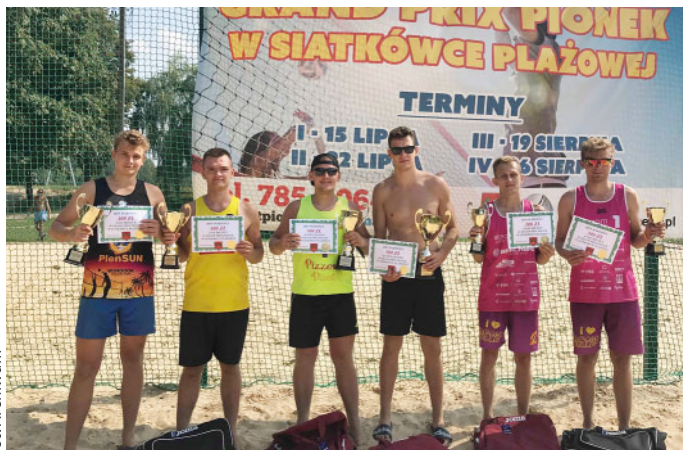
Triumfatorzy tegorocznych zmagania Grand Prix Pionek.

Popularność plażowej odmiany siatkówki w naszym regionie rośnie systematycznie proporcjonalnie do poziomu zmagania. Jedną z najbardziej emocjonujących rozgrywek w ostatnich miesiącach odbyła się w Pionkach.