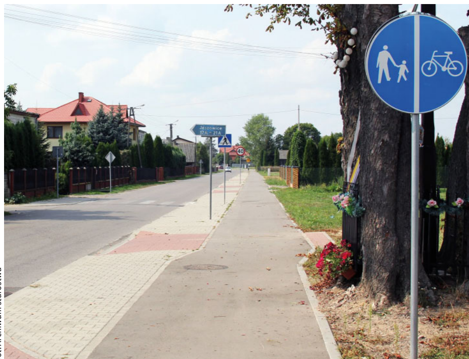
Taką ścieżką rowerową już niedługo pojedziemy nad zalew w Domaniowie.

W 2019 r. tylko za sprawą unijnego projektu „Rozwój infrastruktury w zakresie zrównoważonej mobilności miejskiej na terenie Gminy Miasta Radomia i Powiatu Radomskiego” rozbudowanych zostanie 14 km dróg powiatowych, powstanie 12 km ścieżek rowerowych i 1 km chodnika. Łącznie: infrastruktura liniowa na długości 27 km. To zdecydowanie największa inwestycja w historii powiatu radomskiego!