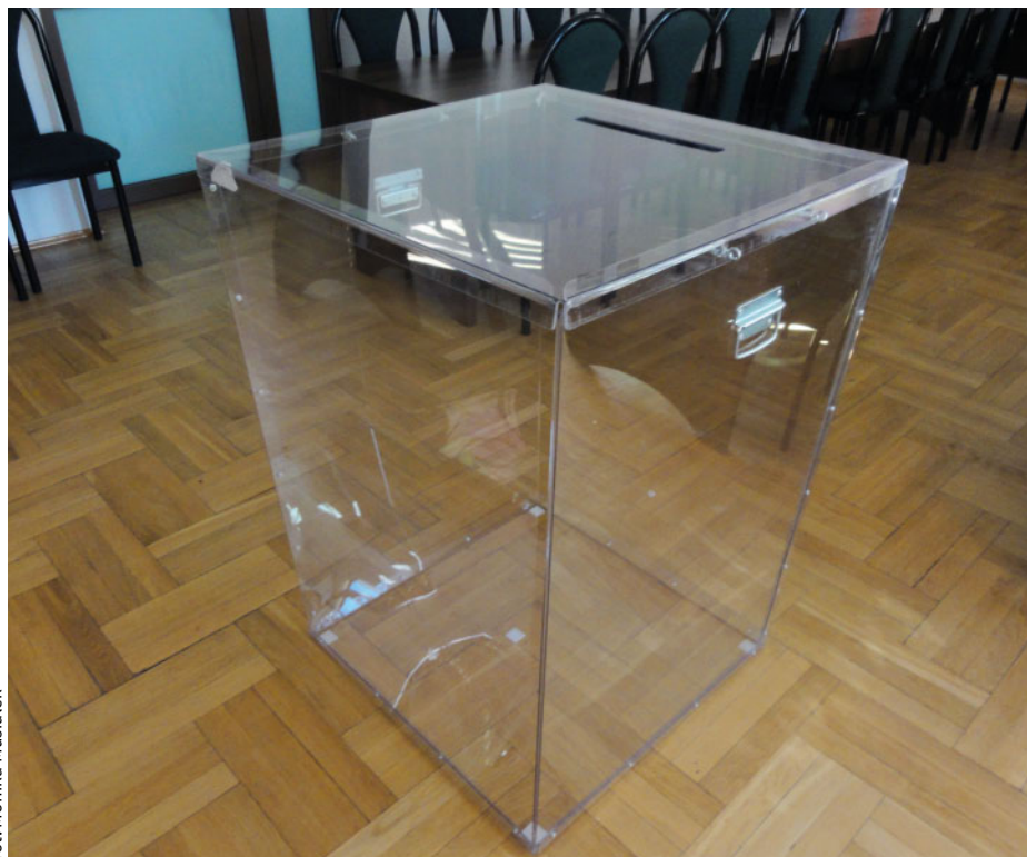
Do takich urn będziemy wrzucać karty do głosowania.

Wybory samorządowe odbędą się w niedzielę 21 października. Natomiast 4 listopada tam, gdzie w pierwszej turze nie zostanie wybrany wójt, burmistrz lub prezydent miasta przeprowadzona zostanie druga tura głosowania, do której przejdzie dwóch kandydatów, którzy otrzymali najlepszy wynik.