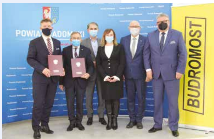
Przedstawiciele wykonawcy, firmy Budromost z władzami powiatu i gminy Kowala po podpisaniu umowy na przebudowę odcinka drogi Kowala - Augustów.

Inwestycję wsparł samorząd gminy Wolanów, który przekazał na budowę ponad 678 tysięcy złotych, czyli 35 procent wkładu własnego Powiatu. - Jestem bardzo zadowolona, że ten odcinek, wybudowany prowizorycznie przez okupanta, zostanie wreszcie przebudowany. Droga była nią tylko z nazwy, nikt nie chciał się przy niej budować, czy lokalizować siedziby swojej firmy. Przebudowa z pewnością poprawi