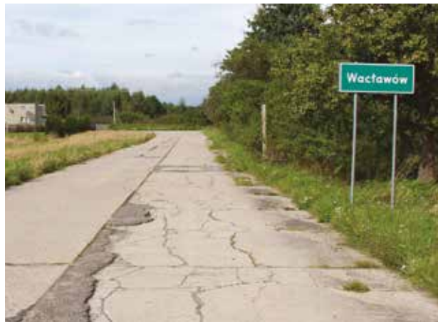
Przebudowany zostanie odcinek drogi Jaszowice – Wactawów – Sławno. To kolejna była droga wojewódzka, przekazana powiatowi w złym stanie technicznym.