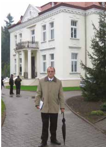
Autor przed dworkiem we Wsoli, w którym przed laty mieszkał Witold Gombrowicz, a gdzie obecnie mieści się muzeum tego pisarza.

chiwalne polegały oczywiście na żmudnym, ale też swoiście ekscytującym, przeglądaniu i rozczytywaniu, z różnym skutkiem, głównie w archiwach w Radomiu, setek tomów ksiąg hipotecznych i różnych dokumentów.