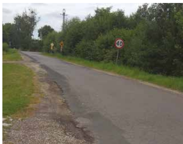
Marszałek Mazowska przekazał powiatowi byłą drogę wojewódzką Kowala – Augustów, która znajdowała się w fatalnym stanie technicznym i wymagała generalnego remontu.