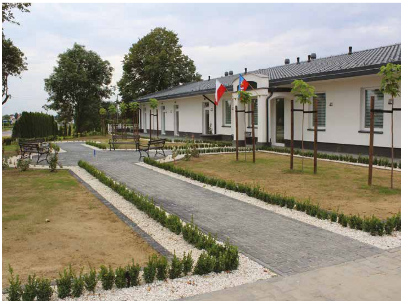
Przykładowa realizacja Centrum Opiekuńczo-Mieszkalnego. Budowa podobnej placówki ma rozpocząć się w tym roku na działce w Krzyżanowicach.

Nowy budynek ma powstać w Krzyżanowicach koło Łży na działce, będącej własnością Powiatu Radomskiego, niedaleko drogi krajowej numer 9. W sąsiedztwie znajduje się powiatowy Dom Pomocy Społecznej, otoczony starym parkiem. Projektowany budynek ma mieć powierzchnię całkowitą około 730 metrów kwadratowych i będzie obiektem 1-kondygnacyjnym z podziałem na część dzienną wraz z jadalnią oraz mieszkalną z 8 jednoosobowymi pokojami. ●