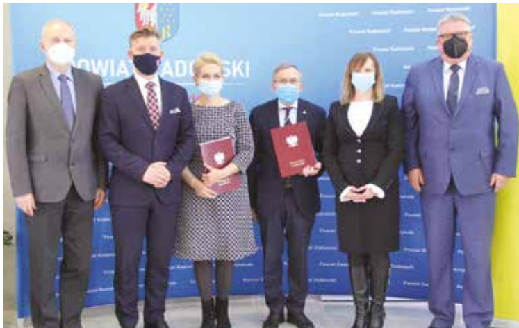
Władze powiatu i gminy Wolanów wraz z wykonawcami prac podpisały umowy na przebudowę odcinka drogi powiatowej Wactawów - Sławno.