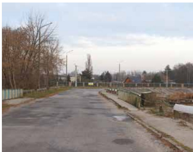
Przebudowany zostanie odcinek ulicy Polnej i Spacerowej wraz z budową nowego mostu na rzece Zagożdżonce w Pionkach.