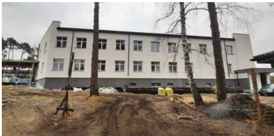
Pierwszy pawilon zabiegowy nowego szpitala powiatowego w Pionkach ma być gotowy pod koniec sierpnia tego roku.

Zakupiono też nowy agregat prądotwórczy, konieczny do zabezpieczenia działalności szpitala w przypadku awarii prądu, oprócz tego zostały wymienione windy osobowa i towarowa wraz z niezbędną infrastrukturą. Na 2021 rok zaplanowano kolejne nakłady, w tym zakupy sprzętu i aparatury medycznej dla Bloku Operacyjnego i Pracowni Endoskopii. Ma zakończyć się całkowita przebudowa i modernizacja Bloku Operacyjnego, a także Działu Chirurgicznego Ogólnego. ●