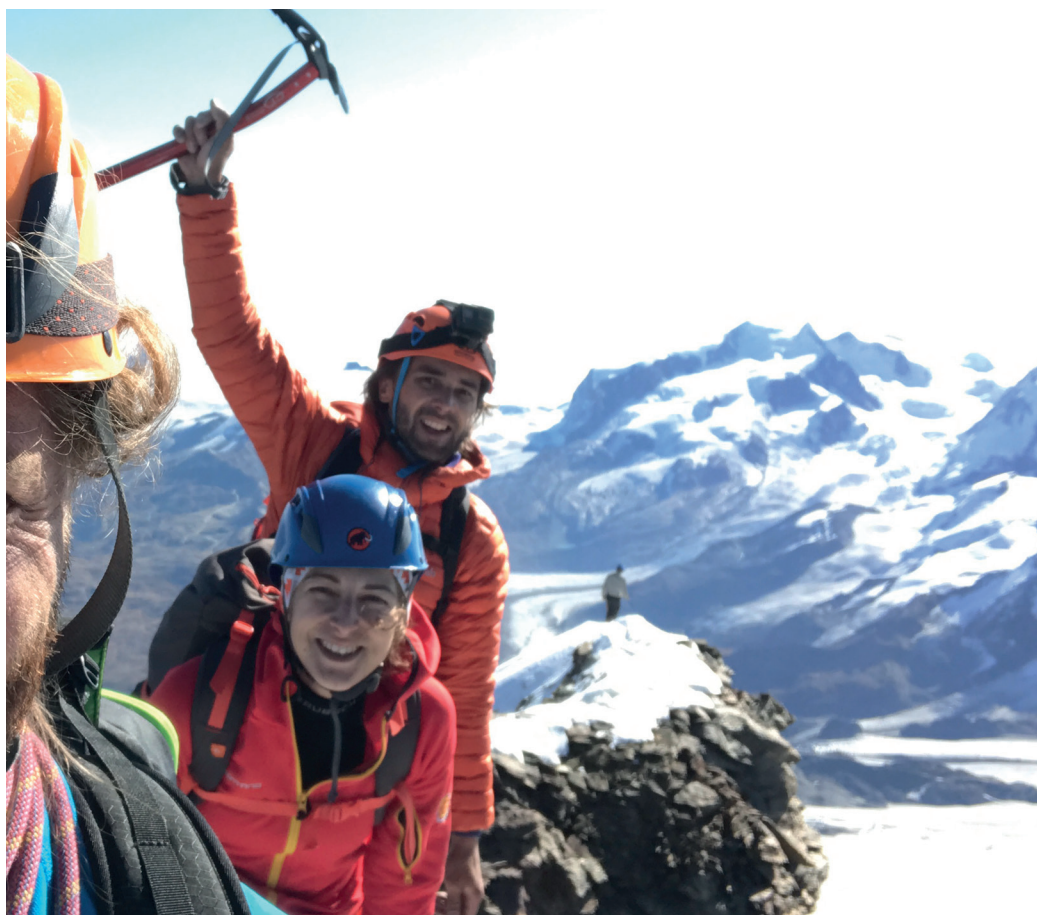
Na najpiękniejszym szczycie Europy Matterhorn (4478 m n.p.m.).