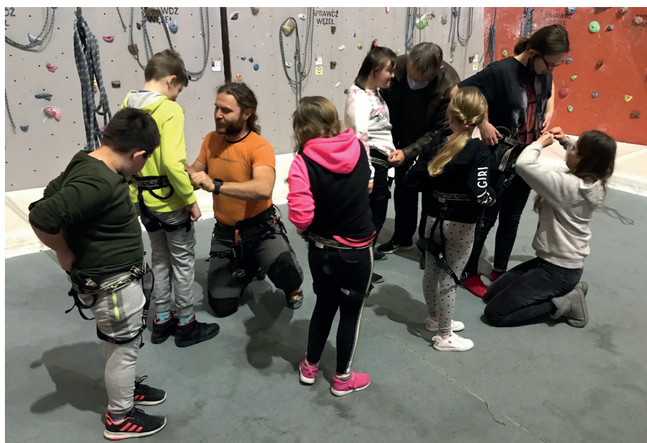
Górołaz swoją wiedzą, pasją i umiejętnościami dzieli się zarówno z dorosłymi, jak i młodzieżą podczas wielu spotkań i prelekcji.