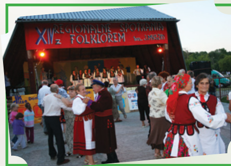
„Spotkanie z folklorem im. J. Myszki” w Iłży