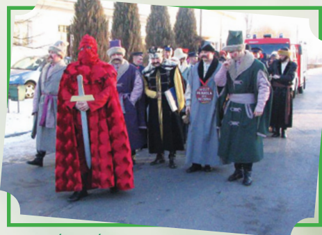
Obrzęd „Ścięcia Śmierci” w Jedlińsku

Równie barwną imprezą jest tradycyjny obrzęd „Ścięcia Śmierci”, który odbywa się w Jedlińsku. Osada ta posiadała niegdyś prawa miejskie, a także cenione prawo miecza. Ten unikalny spektakl przyciąga każdego roku w ostatni dzień karnawału nie tylko mieszkańców Jedlińska, lecz także liczne grono zainteresowanych z całego kraju.