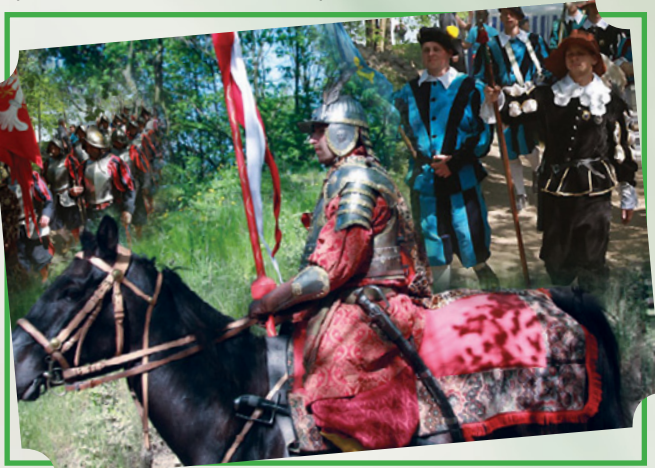
Turniej rycerski na zamku w Iłży

Bogate tradycje życia kulturalnego kontynuuje Iłża. W miejscowym Domu Kultury działają zespoły artystyczne i liczne koła zainteresowań. W ostatnich latach ponadregionalną rangę zdobyły imprezy: „Dni Leśmianowskie”, „Ogólnopolskie Spotkania z Balladą” oraz „Turniej Rycerski na zamku w Iłży”. Ta pierwsza jest jednym z najważniejszych wydarzeń kulturalnych w naszym regionie. Powstała, by zachować pamięć o „Iłżeckim wątku” w literackiej biografii poety, który szczególnie upodobał sobie to malownicze miejsce.