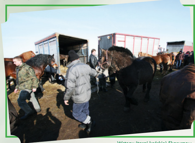
Wstępy (targi końskie) Skaryszew

Powiat radomski kojarzy się z wieloma wyjątkowymi i niepowtarzalnymi imprezami handlowymi i kulturalnymi, często o wielowiekowej tradycji. Jedną z nich są Skaryszewskie Wstępy - targi końskie odbywające się w pierwszy poniedziałek i wtorek Wielkiego Postu. Przywilej organizacji targów sięga XV w. Od dziesięcioleci przybývają na nie, obok polskich hodowców, kupcy - m.in. z Włoch, Niemiec oraz liczna grupa turystów.