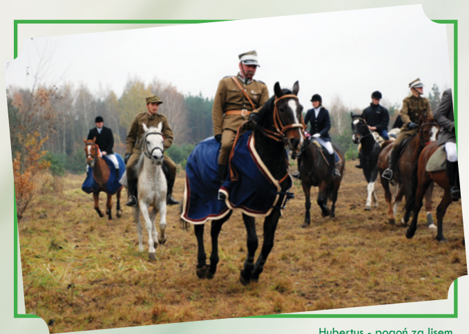
Hubertus - pogoń za lisem