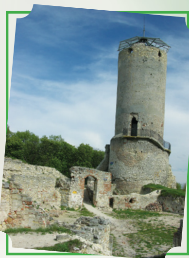
Iłża - ruiny zamku biskupów krakowskich

W kilkunastu miejscowościach powiatu znajdują się interesujące obiekty zabytkowe, kościoły, dwory, parki i inne miejsca związane z historią regionu. Najciekawsze to