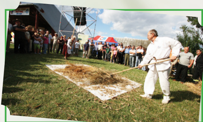
Młócenie zboża cepem podczas dożynek powiatowo-gminnych