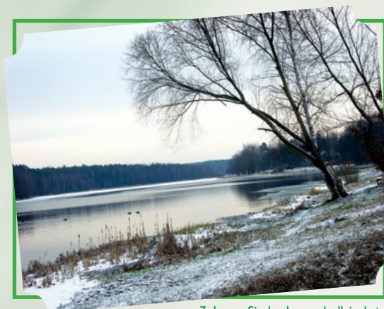
Zalew w Siczkach, gm. Jedlnia-Letnisko

Północną część powiatu obejmuje Nizina Kozienicka, południową Przedgórze Iłżeckie, środkową zaś stanowi Nizina Radomska. Spośród 13 jednostek samorządowych większość to gminy typowo wiejskie: Gózd, Jastrzębia, Jedlińsk, Jedlnia-Letnisko, Kowala, Pionki, Przytyk, Wierzbica, Wolanów, Zakrzew; dwie są gminami miejsko-wiejskimi: Iłża i Skaryszew; a dwudziestotysięczne Pionki to gmina miejska. Niewątpliwym atutem powiatu jest położenie w centrum subregionu radomskiego, miejscu, w którym krzyżują się strategiczne szlaki komunikacyjne relacji wschód - zachód i północ - południe: kolejowe (Lublin - Radom - Łódź i Warszawa - Radom - Kraków) oraz drogowe (drogi krajowe nr: 7, 9 i 12). Dodatkowym walorem powiatu jest bezpośrednie sąsiedztwo Radomia, największego po Warszawie miasta Mazowsza, znaczącego ośrodka akademickiego, handlowego i usługowego.