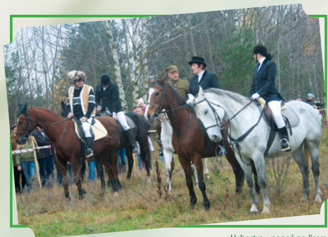
Hubertus - pogoń za lisem

W siedzibie Studenckiego Klubu Jeździeckiego w Lesiowie od kilku lat organizowany jest Bieg Myśliwski za Lisem „Hubertus”, przyciągający coraz licniejszą grupę miłośników. W biegu startuje kilkadziesiąt koni. Przybyli z wielkim zainteresowaniem wypatrują uników lisa, w którego rolę wciela się jeden z uczestników zabawy. Jeźdźcy znikają w lesie, to znów pojawiają się na polanie (którą zza barierki śledzi tłum widzów), aby zbliżyć się do lisa. Ten jednak czyni swoją powinność, broniąc się przed polującymi. Wyścig jest okazją do dobrej zabawy, poprzez zdrową rywalizację i nawiązanie do tradycji myśliwskich. Głównym trofeum biegu jest Puchar Rektora Politechniki Radomskiej oraz nagroda Wojewódzkiego Związku Hodowców Koni.