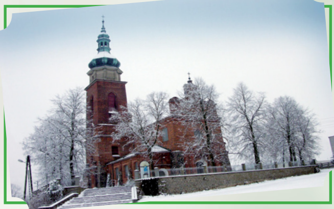
Kościół p.w. św. Stanisława w Cerekwi - gm. Zakrzew

Jankowice - Gulin-Młyn - Sachalin - Gulin - Patolek - Gulinek - Kresy - Zakrzew - Jaszowice - Oblas - Domaniów