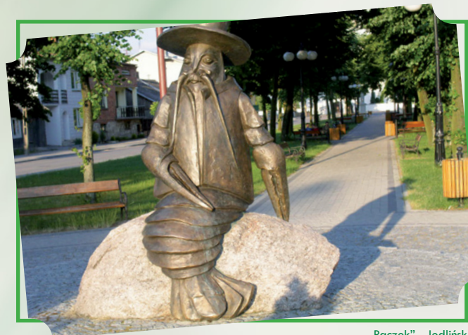
„Raczek” - Jedlińsk