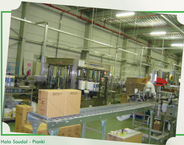
Hala Soudal - Pionki

Dzięki dostępności komunikacyjnej, atrakcyjności pod względem gospodarczym, wysokiemu poziomowi rozwoju lokalnego przemysłu, chłonnemu rynkowi pracy, a także walorom krajobrazowym, na terenie powiatu zarejestrowanych jest już około 10 000 podmiotów gospodarczych, produkujących na rynek lokalny, krajowy oraz międzynarodowy. 96 proc. przedsiębiorstw znajduje się w sektorze prywatnym, co świadczy o dobrych podstawach dla jego dalszego rozwoju. Doskonale warunki do ich funkcjonowania zapewniają także Specjalna Strefa Ekonomiczna na Starachowice Podstrefa w Iłży oraz Tarnobrzeska Specjalna Strefa Ekonomiczna Podstrefa w Radomiu i Pionkach.