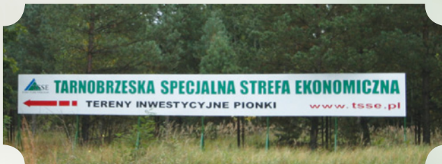
Tarnobrzaska Specjalna Strefa Ekonomiczna - Pionki

Zachęcamy do inwestowania w powiecie radomskim, miejscu, gdzie rozwinięta gospodarka płynnie przeplata się z nienaruszoną przyrodą.