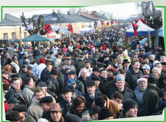
Wstępy (targi końskie) Skaryszew

Na jarmarku można nabyć także między innymi: bryczki, uprzęż, zaprzęg, a ponadto baty, kapelusze, odzież. Na głównym trakcie nie brak wyrobów z wikliny, garncarstwa, rzeźby ludowej. W powietrzu unosi się zapach tradycyjnych wiejskich potraw: pieczonych kiełbasek i grochówki. Na scenie odbywają się występy kapel ludowych z regionu. Rolę gospodarza pełni burmistrz, który na estradzie ustawionej na głównym trakcie wita przybyłych gości - posłów, burmistrzów, wójtów, radnych z powiatu i gminy. Obecnie też honorowi goście - marszałek, wojewoda i starosta wybijają na tę okoliczność specjalne pamiątkowe monety „Skaryszewski Jarmark Koński Wstępy”, które wystawia się na sprzedaż.