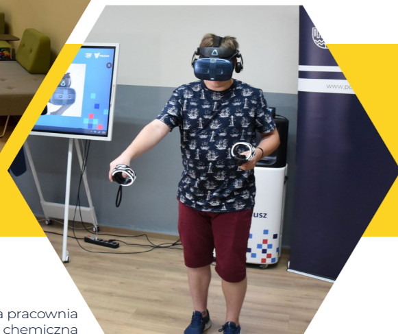
wirtualna pracownia chemiczna

Z kolei w 2022 roku powstało wielofunkcyjne boisko szkolne wraz z ogrodzeniem przy Młodzieżowym Ośrodku Wychowawczym w Wierzbicy. Inwestycja została zrealizowana przy pomocy dotacji z budżetu samorządu województwa mazowieckiego. Placówka, jeszcze w pandemii zagrożona likwidacją, dzięki staraniom Zarządu Powiatu wyszła na prostą i przebywa w niej blisko 50 wychowanek.