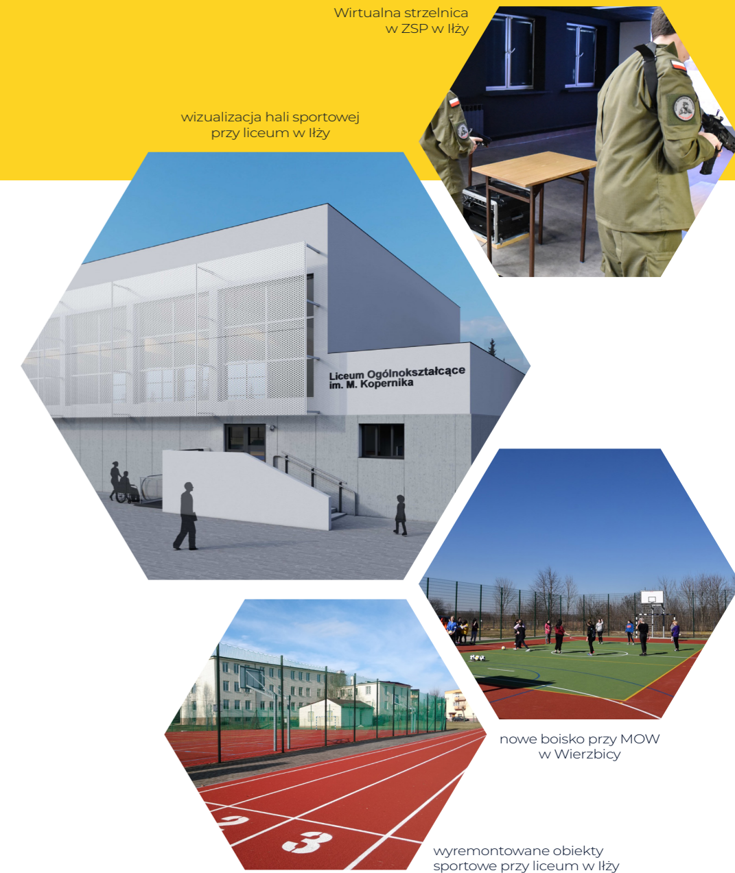
Wirtualna strzelnica w ZSP w Iłży