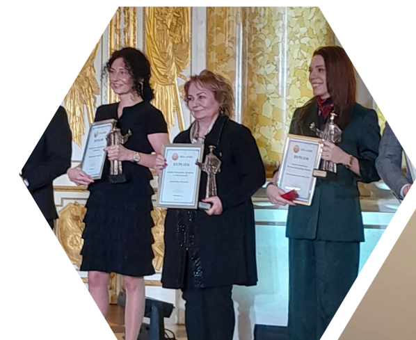
Tytuł Szkoły Roku w Polsce 2022 dla placówki w Chwałowicach.