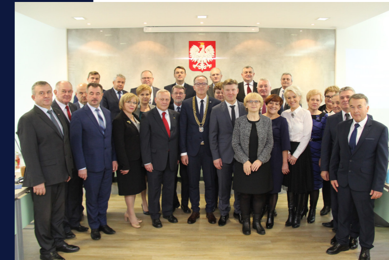
Rada Powiatu w Radomiu VI kadencji:

W pełni szanując osiągnięcia władz samorządowych poprzednich kadencji, obiektywnie trzeba przyznać, że takiego rozmachu inwestycyjnego, jak w obecnym pięcioletniu nie było w historii Powiatu Radomskiego. Ponad 30-procentowy udział wydatków majątkowych w wydatkach ogółem budżetu, a w bieżącej kadencji, w latach 2018-2023 wydatkowano ponad miliard złotych! Kwota ta to skutek prężnego działania obecnego Zarządu Powiatu w zakresie skutecznego pozyskiwania środków zewnętrznych. Pragnę też gorąco podziękować wszystkim Radnym obecnej kadencji. Wyrazy szczerego uznania i szacunku przekazuję też wszystkim pracownikom powiatowej administracji w Starostwie oraz jednostkach organizacyjnych powiatu.