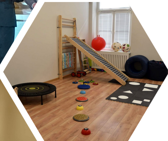
Nowoczesne wnętrza Zespołu Szkół i Placówek w Chwałowicach.