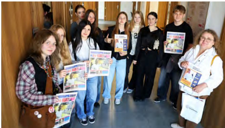
Czym zajmuje się Starostwo Powiatowe i jego poszczególne jednostki? Odpowiedzi na te pytania poznali ósmoklasiści ze szkoły podstawowej w Jastrzębi, którzy odwiedzili nasz urząd.